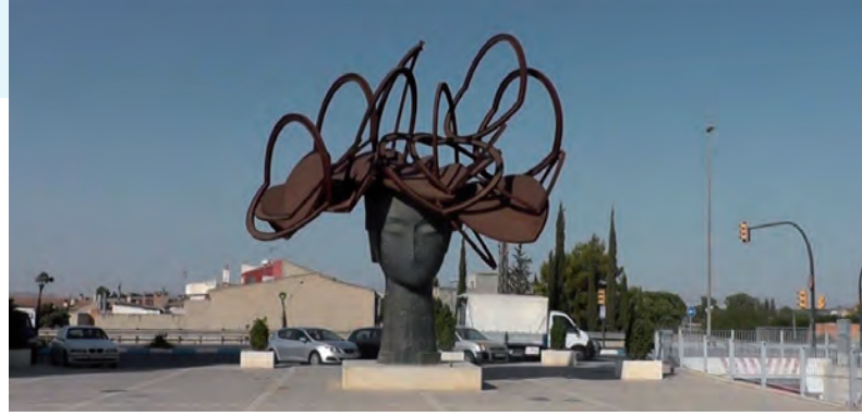
La dama de Molina

polígonos industriales para empresas y almacenaje regulador del comercio local y provincial. Nació el importante Centro Tecnológico de la Conserva y, finalmente, las glosinas.