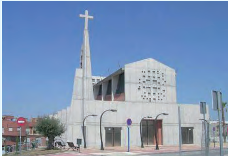
Iglesia de la Sagrada familia (Molina)