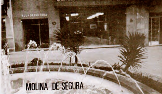
MOLINA DE SEGURA