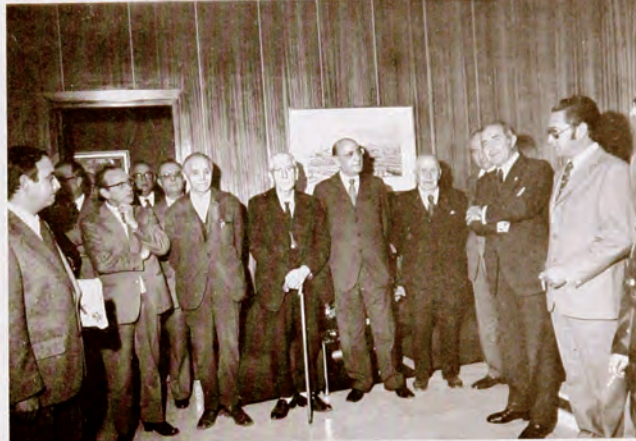
MOLINA DE SEGURA Edificio social de la Caja, dotado, ahora, con Aula de Cultura