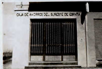
Ribera de Molina