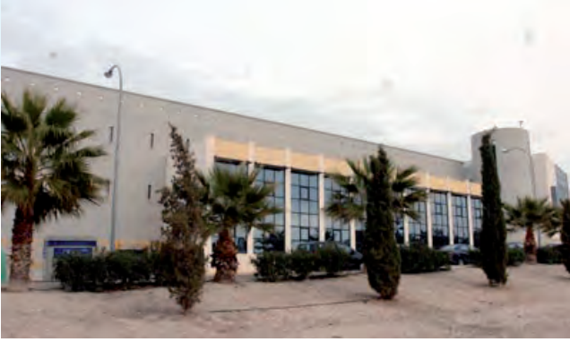
Centro tecnológico de la conserva