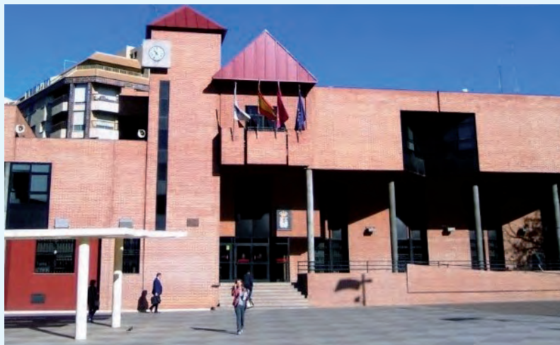
Ayuntamiento de Molina